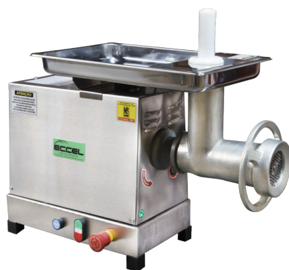
Moedor de Carne