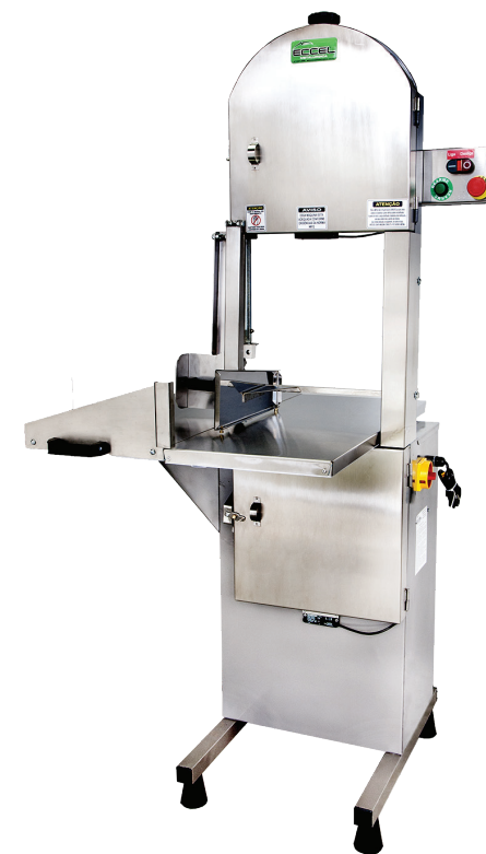
Serra de Fita Inox