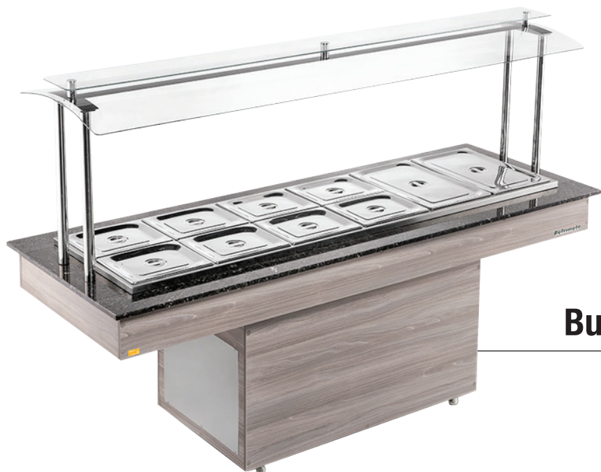
Buffet Restaurante Central