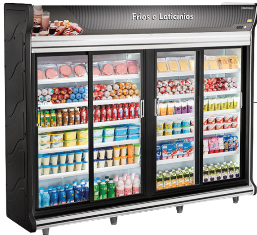
Frios e Laticínios