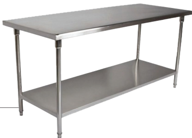
Mesa Inox Industrial