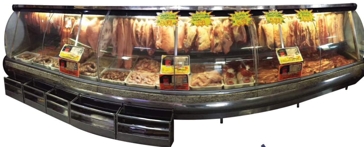
Expositor de Açougue