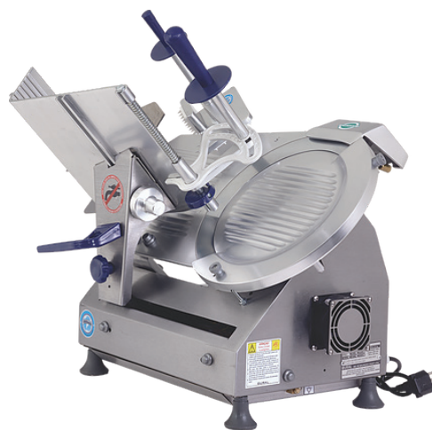
Cortador de Frios