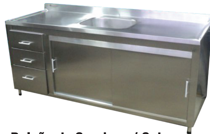
Balcão de Serviço c/ Cuba