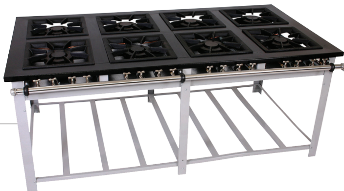
Fogão Maxi Inox 8 Bocas